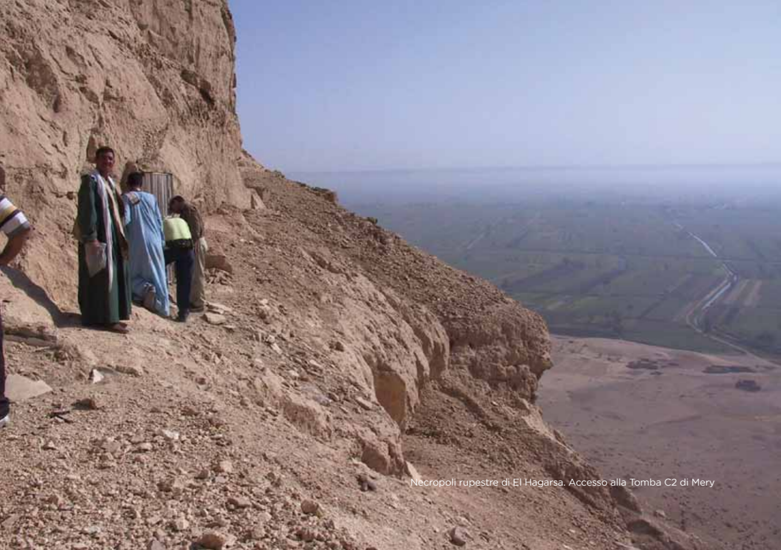
Necropoli rupestre di El Hagarsa. Accesso alla Tomba C2 di Mery